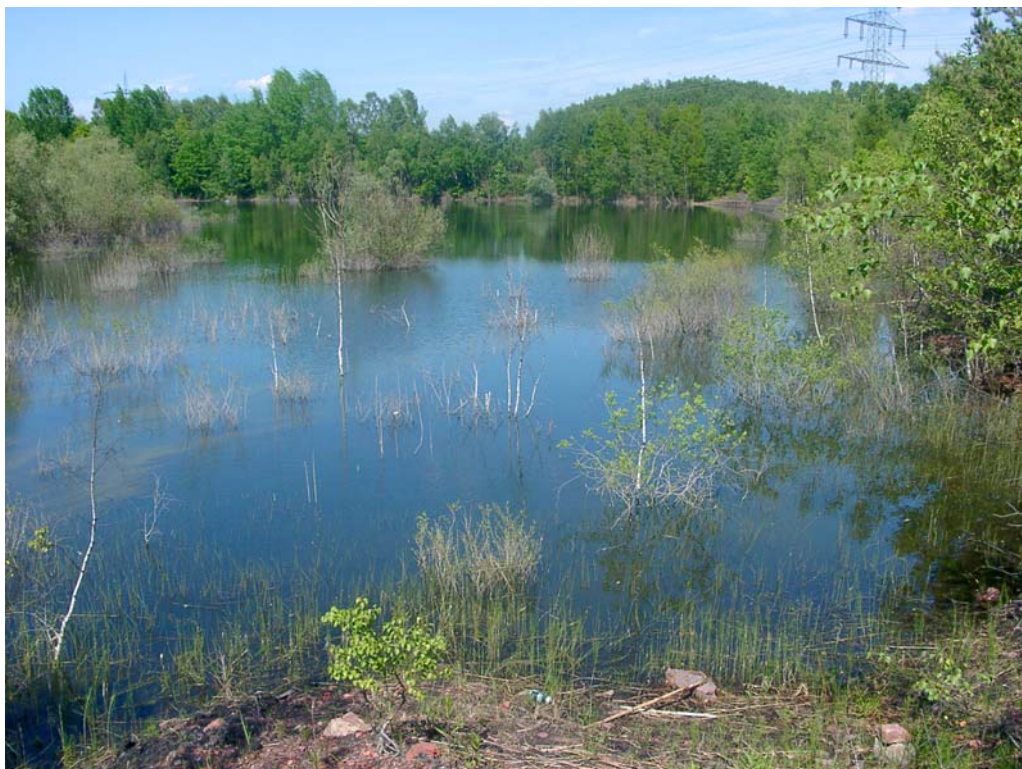
Abb. 10: Habitataufnahme aus der südwestlichen Ecke von Gewässer 233 vom 21.05.02: erfolgreiche Reproduktion von L. caudalis , A. affinis und A. parthenope