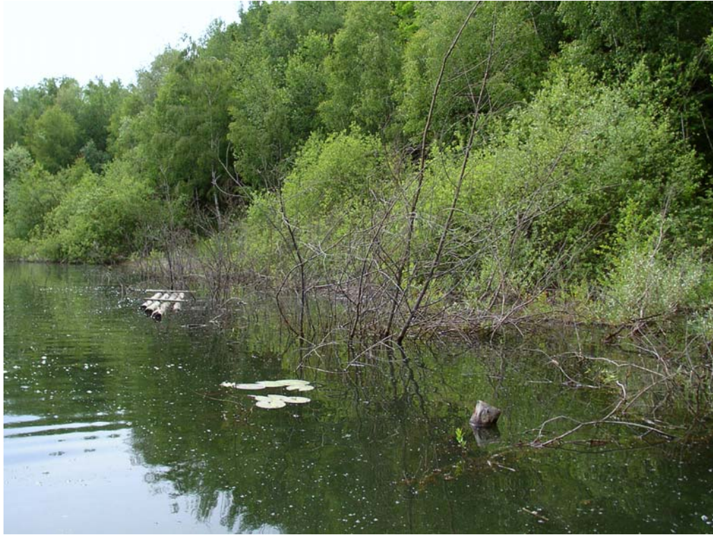
Abb. 7: Großer Schlammweiher (Gewässer 223) am 26.06.04 mit Flugbereich von L. caudalis