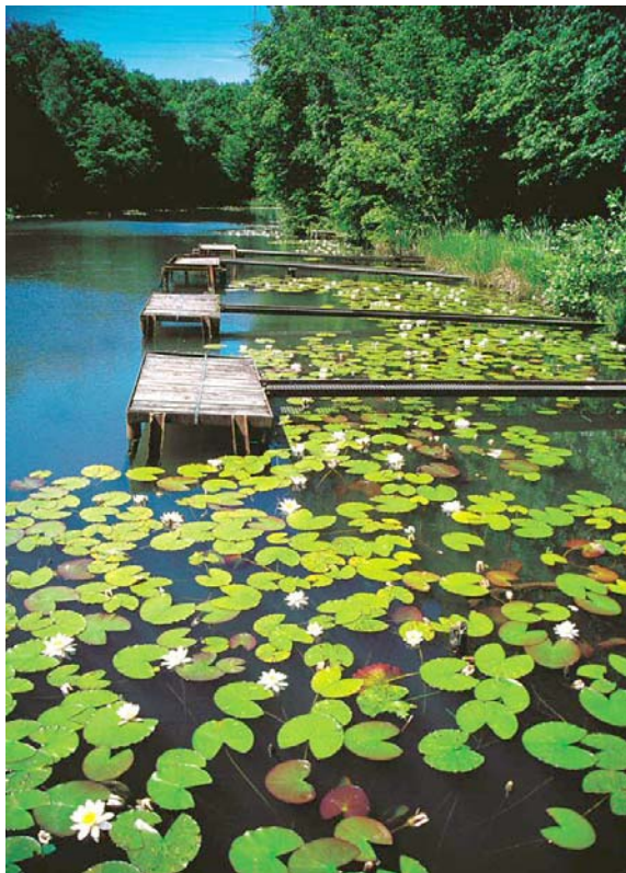
Abb. 5: Fischteich mit erlebbarem Schwimmblattgürtel (Nordufer von 219)