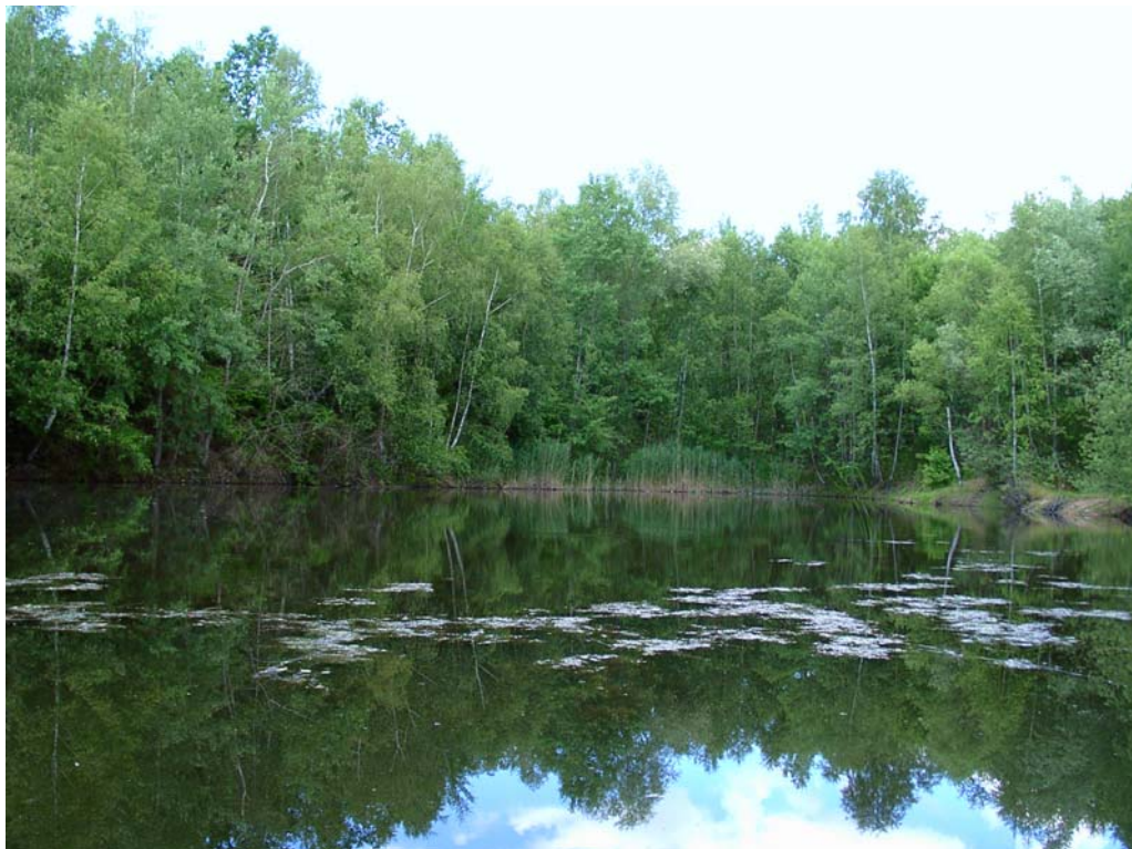
Abb. 8: Gewässer 225: am 20.06.04 zwei Imagines von L. caudalis auf der oberflächennahen Submersvegetation