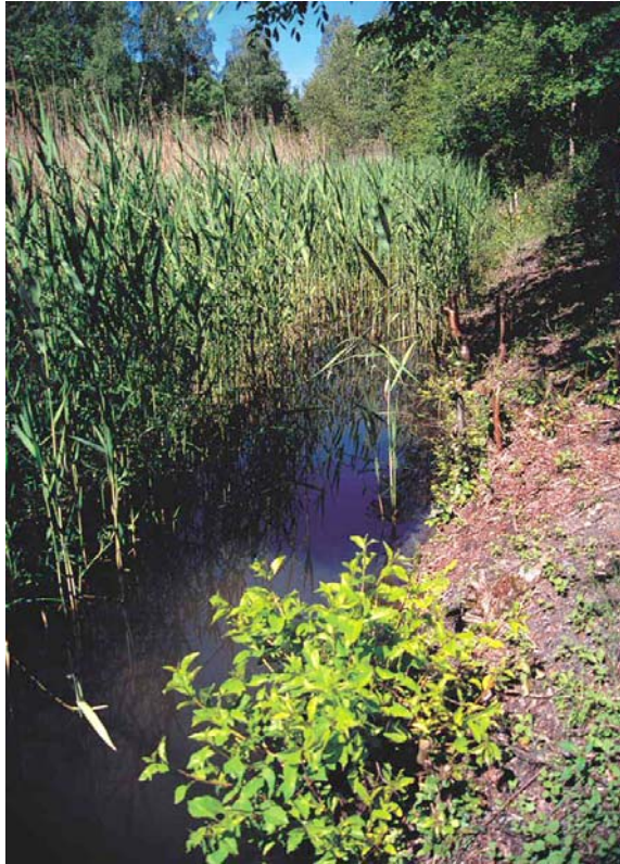
Abb. 3: Graben (Heinitzbach) im Binsental mit Fundstelle von C. mercuriale (218)