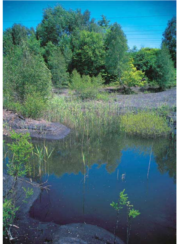
Abb. 4: Typische Habitate: vegetationsarme Flachwasserstellen auf Kohleschlamm (227)