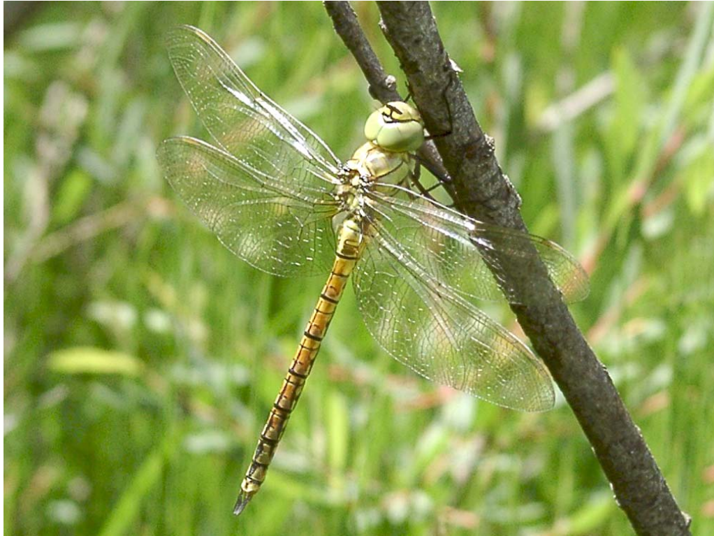
Abb. 9: 17.06.2004 (14:25 Uhr): juv. Aeshna affinis , erster Fortpflanzungsbeleg für das Saarland